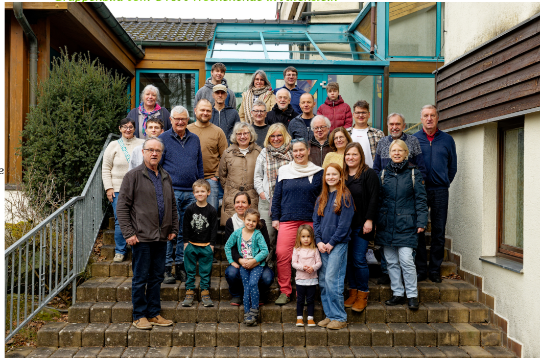
Gruppenbild vom CVJM-Wochenende in Altenstein

Derzeit können wir leider kein eigenes Angebot machen.