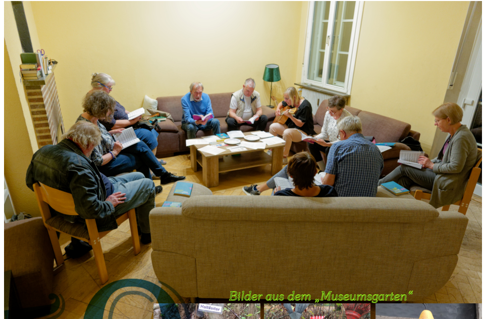
Bilder aus dem „Museumsgarten“

Genauere Informationen auf Seite 7 in diesem Programm.